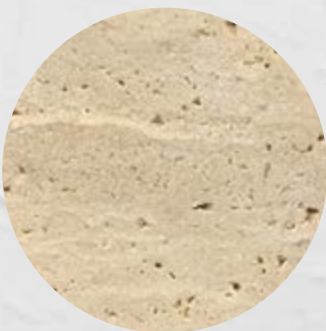
112. Mármore Travertino Romano