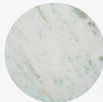
102. Mármore Branco Pinta Verde