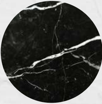
109. Mármore Nero Marquina