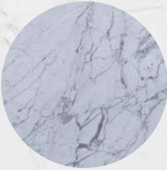
106. Mármore Carrara Giolia