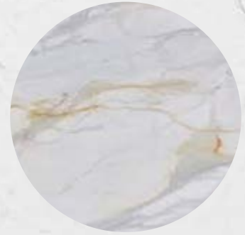
108. Mármore Calacata