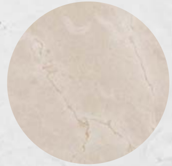
111. Mármore Crema Marfil