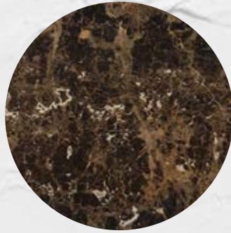
107. Mármore Marrom Imperador