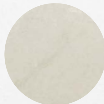
105. Mármore Champanhe