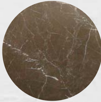
110. Mármore Bronze Armani