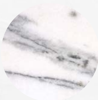
104. Mármore Carrarina Nacional