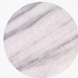
101. Mármore Branco Rajado Cinza

Indicamos o uso de mármore em superfícies de baixo tráfego, para evitar o desgaste já que se trata de uma pedra muito porosa. Além disso, ela pode ser utilizada para revestir paredes de destaque e em detalhes na casa, como, por exemplo, parapeitos de janelas e mesas de centro.